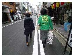
町会福祉部による戸別訪問