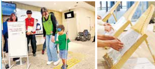
◀ヘルマンハーブ ※イメージ

“だれでも弾ける楽器” ヘルマンハーブ、ジュースやコーヒーなどを楽しみながら、車いす・手話・白杖体験&トイレットペーパーラッピングが体験できます。お気軽にご参加ください♪