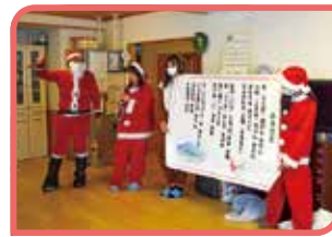
高齢者施設、サロン、障がい児施設へ伺いました

今回のボランティアを通じて、対面での交流の良さを実感するとともに、今後も地域とのかかわりを通じてたくさんの方が笑顔になってほしいと思う1日となりました。