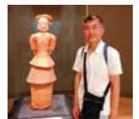
埴輪女子とのツーショット (東京国立博物館にて)

※本誌に掲載されている情報は、新型コロナウイルス感染拡大防止のため、延期または中止とさせていただく場合がございます。ご理解の程、よろしくお願い申し上げます。