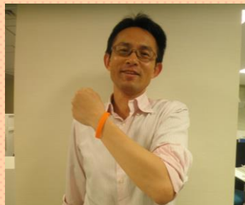
※次回は7月12日(火)に開催予定です。

で、どうすればよいのか……。みなさまも「認知症サポーター養成講座」に参加なさいませんか。認知症を正しく理解し、認知症の人やその家族を応援する人。それが「認知症サポーター」です。目印のオレンジリングを身につけ、さあ、応援にゆきましょう。