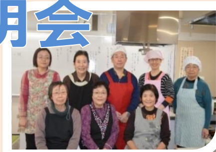
食事づくりをしているボランティアの皆さん

活動に参加するとポイントがたまり、年間最大8000円の 交付金が受けられます（高齢者を対象にした制度です）。