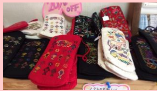
バングラデシュのノクシカタ刺繍

ボラ記者をし、私は様々なボランティアの方々や施設の方々、関わる職員さんに出会う中で、毎回素敵な人に関わることが出来、幸せだと感じる。ボランティアだと気張らずに、自分の関わりたいと思う所へ少し足を運び、出来ることをしてみるというのも、素敵な出会いに繋がるかと思う。皆様も活躍できる場所を探して、ボランティア活動に挑戦されてみてはいかがだろうか。