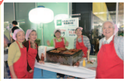
▲毎回大盛況の飲食ブース