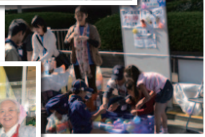
▲子ども縁日の ヨーヨーすくい