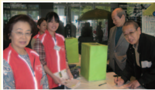
▲来場の方をご案内するコンシェルジュの皆さま