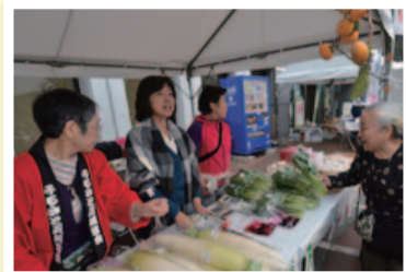
新鮮な産地直送品が▲ 並ぶ物産展